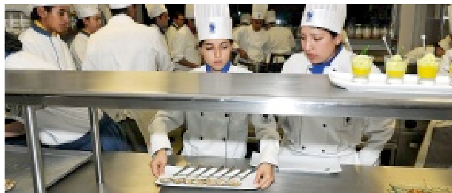
Los alumnos prepararon y sirvieron todo el coctel.