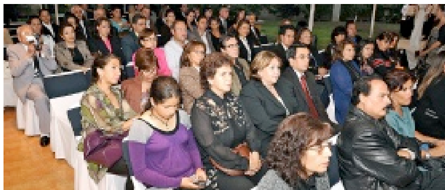
Los familiares escucharon la propuesta académica de CESSA.